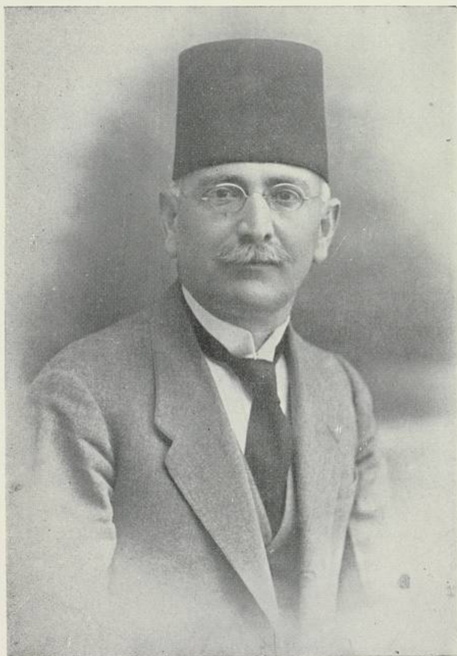
اؤستاز الرئیس محمد کرد علی (۱۸۷۶ - ۱۹۵۳)