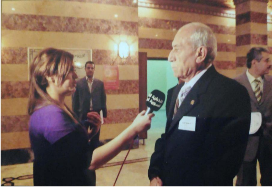
في المؤتمر الأخير لمجمع اللغة العربية بدمشق